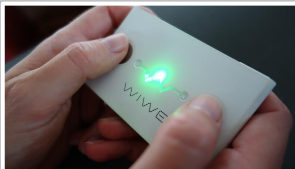
Kártya méretű. Kényelmes, hiszen elegendő két ujj a méréshez!

Abban az esetben, ha PIROS jelölésű eredményt kap, rendelői EKG vizsgálat, illetve további szív- és érrendszeri vizsgálatok lehetnek szükségesek. Konzultáljon házi orvosával!